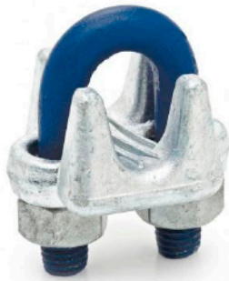
G-450 Acero forjado